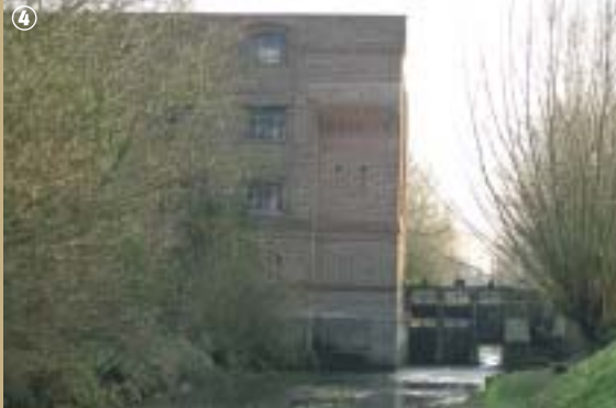
Ancien moulin - Sautbois

Dans le second, seule papeterie du Hainaut jusqu'au 19 e siècle, on employait 11 ouvriers qui produisaient 12 espèces différentes de papiers. Transformé en moulin à farine en 1841, il servit à fournir de l'électricité de 1922 à 1950. Ce moulin aura donc exercé plusieurs métiers en 2 siècles, fournissant successivement de l'huile, du papier, de la farine et de l'électricité... Encore vivants ou éteints, tous en la Selle ont su trouver l'énergie qui les faisait tourner !