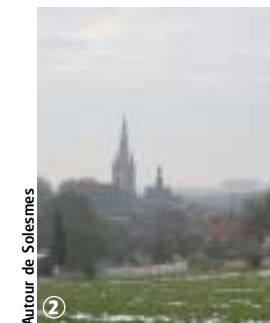
Autour de Solesmes