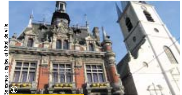
Solesmes : église et hôtel de ville

Randonnée Pédestre Au Pays de Barbari : 10 km