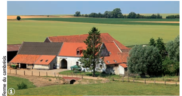
Ferme du cambrésis

(10 ou 16 km - 2 h 30 à 3 h 00 ou 4 h 00)