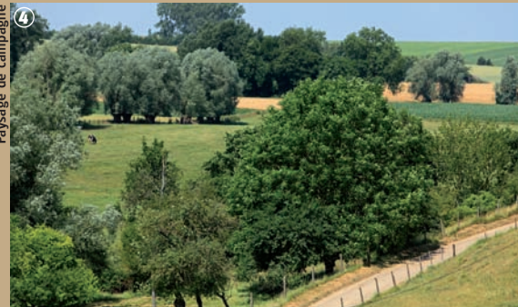
Paysage de campagne

Aujourd'hui, ces plateaux érodés donnent au paysage un aspect accidenté, mais ajoutez à cela la rivière, les vaches et un cortège de saules têtards, vous trouverez, c'est sûr, que cet endroit a des faux airs de Normandie !